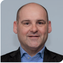
Drs. S.A. van der Eerden Huisarts/praktijkhouder