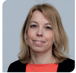
Drs. C.P.G.M. Linden-Beckers Huisarts