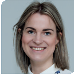
Drs. J. Bohnen Huisarts