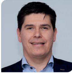
Drs. L.J.J.M. Harings Huisarts/praktijkhouder